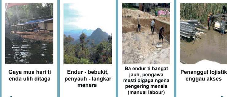
FASA NGAGA ENGGAU MASANG (PENGLAMA TI DIJANGKA: 12 BULAN)